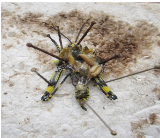
Figure 1: localisation des larves de Blaesoxipha bakweria dans la cavité générale de Zonocerus variegatus .

NB: Les valeurs du tableau représentent les prévalences ou l'abondance et leur intervalle de confiance. Entre parenthèse, le nombre d'individus parasités (prévalence) et le nombre de parasite (abondance). L=larve ; 1-6=stades larvaires.