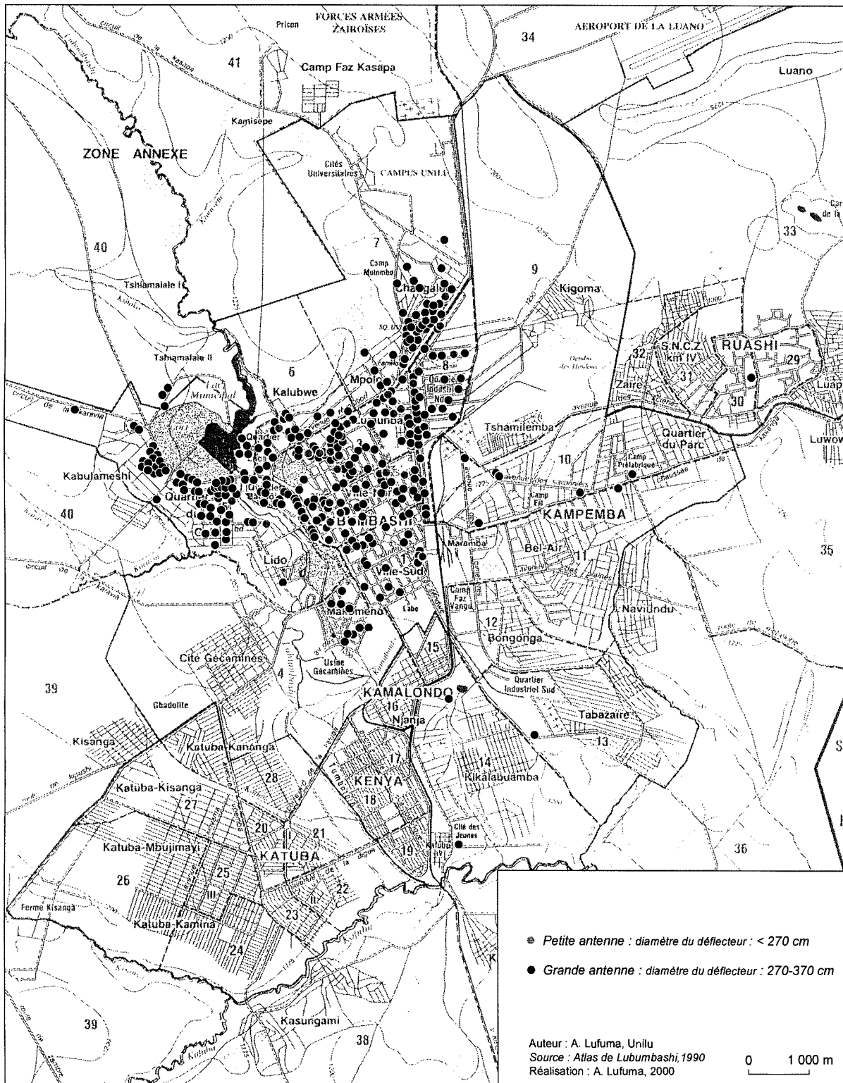
Figure 2. Localisation des antennes paraboliques à Lubumbashi