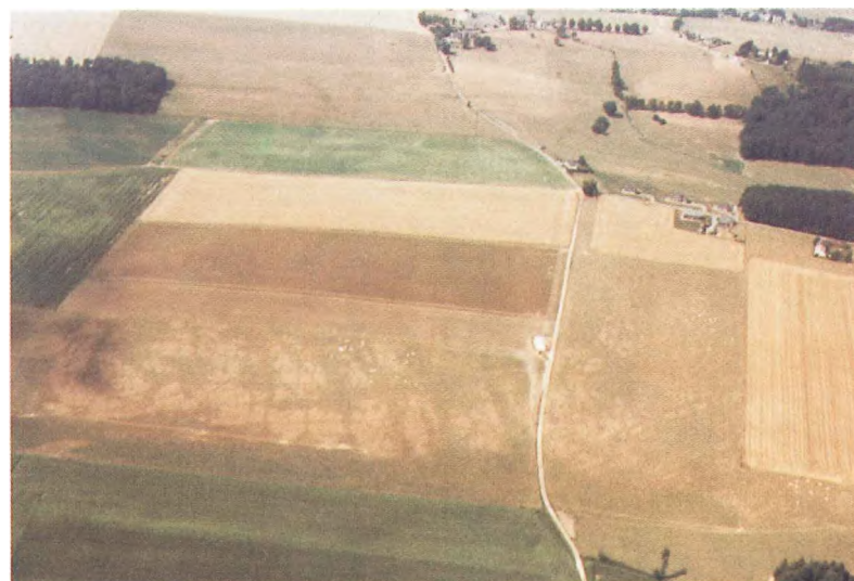
Photo 9. Photo du 18-08-95 montrant à l'est de Sovet (Ciney) l'assise de Dinant et plus précisément la sous-assise V 1 constituée de marbre noir (Formation de la Molinee). Le dessin en forme de treillis est la manifestation du réseau de diaclases (N-S) et de joints de stratification (E-W) du calcaire.