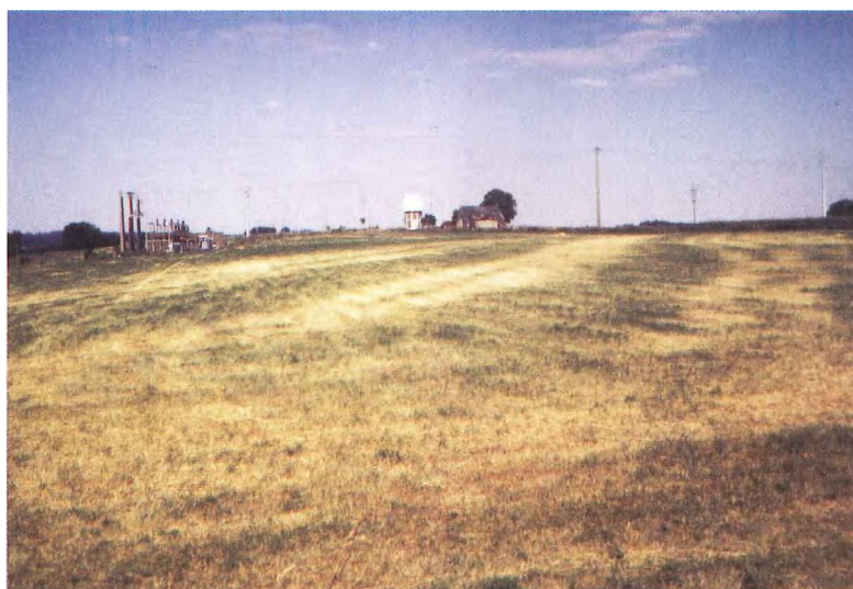
Photo 6. Vue au sol de la structure géologique visible à l'est de Fontin (Esneux) en 1995. Le château d'eau visible sur cette figure est apparent sur la figure 8.