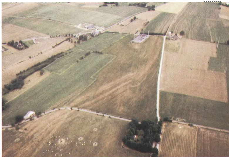
Photo 7. Photo prise à l'est de Fontin (Esneux) le 5/8/94 et montrant la signature géologique du Famennien supérieur ainsi qu'une faille localisée à peu près au centre de la photo. La figure 7 a été prise près de l'extrémité supérieure de cette photographie mais dans la direction opposée.