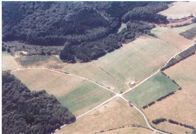
Photo 5. Photo du 10-8-95 à l'est de Sinsin (N-O de Marche-en-Famenne). La fine stratification correspond d'après la carte géologique aux formations situées entre l'assise inférieure du Fa 1 (anciennement, assise de Senzeille) et le sommet du Frasnien (autrefois assise de Matagne) là où les premiers schistes alternent encore avec quelques lits calcaires.