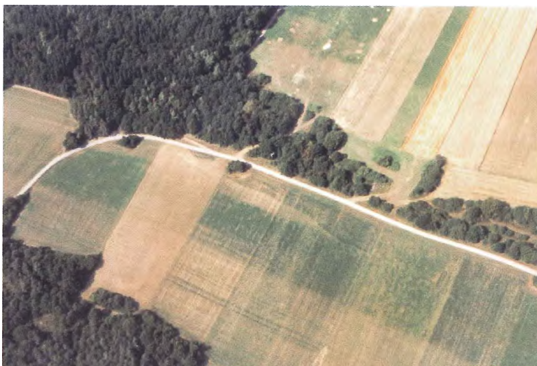
Photo 3. L'espace cultivé entre la route et le bois au bas de cette photo prise au nord de Resteigne permet de voir l'aspect du Gva et du Gvb des anciennes cartes géologiques. Le Gva apparaît en surface comme un faciès finement lité (près du bois au bas de la photo) tandis que le Gvb (près de la route) correspond à une bande beaucoup plus large de calcaire.