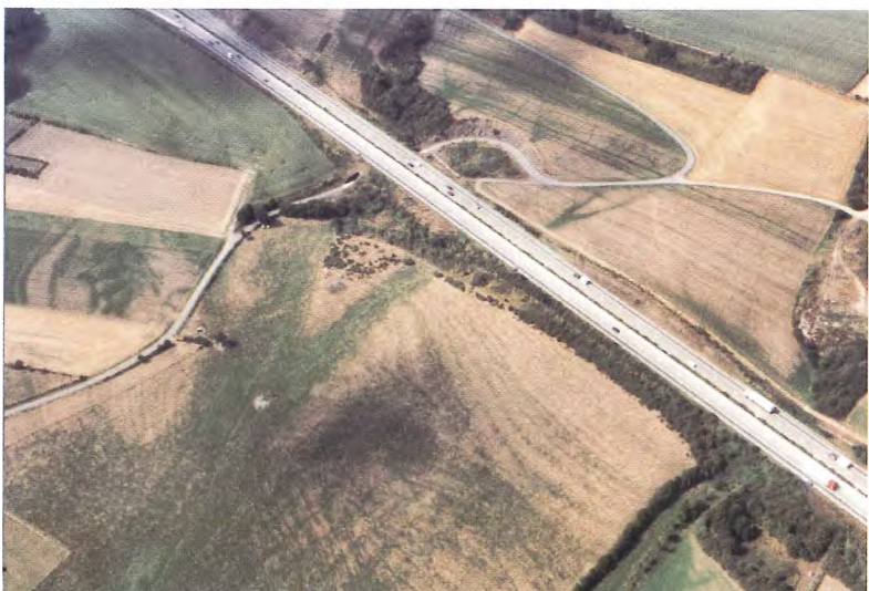
Photo 2. Vue de la structure complexe de l'Eifelien au nord de Chanly. La structure géologique disparaît dans le thalweg plus humide qui, depuis l'autoroute, se dirige vers le coin inférieur gauche de la photo.