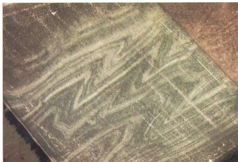
Photo 8. Pli complexe des couches du Famennien supérieur apparaissant dans un champ de betteraves à l'ouest de Scy.