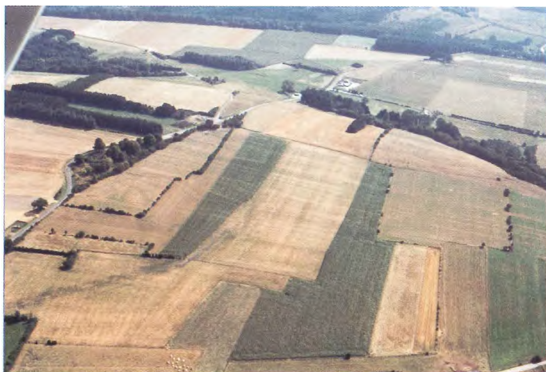
Photo 1. Photo montrant la structure géologique finement litée de l'Eifelien au sud de Wellin, au lieu-dit « Devant le Tienne de Monsais ».