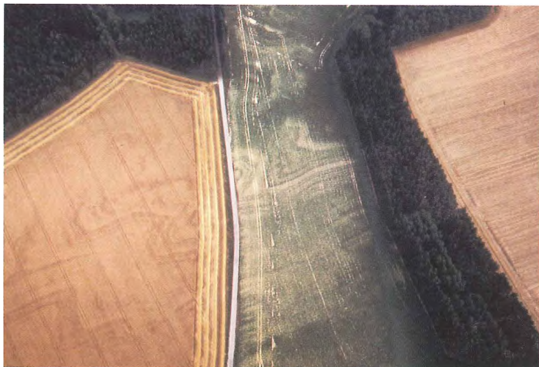
Photo 10. Photo prise le 5 août 1994 montrant la structure géologique plissée du Famennien supérieur qui apparaît parfaitement sous les betteraves ( en vert), transparait à gauche dans un champ de froment en cours de récolte et n'est absolument pas visible à droite dans un champ de céréales entièrement récolté.