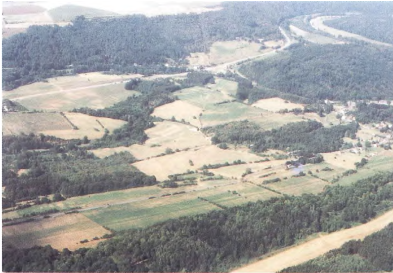
Photo 4. Photo prise le 18-08-95 au nord de Tohogne. Les couches particulièrement bien visibles à l'avant-plan de la photo seraient dues à l'alternance de schistes et de calcaires noduleux au sein du Groupe de Frasnes.